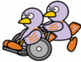
埼玉県マスコット コバトン介護

発症します。これらは右の半身浴で改善することができます。他には花粉症やハシカなど外的要因での発症があり早めに診療しましょう。