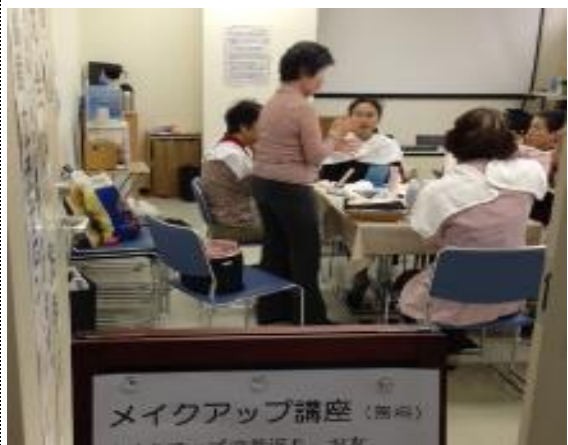
【メイクアップ講座風景】